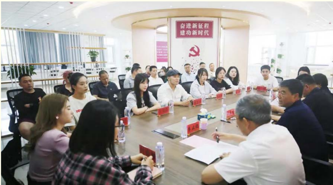
座谈会现场，右侧左二为折喜文书记