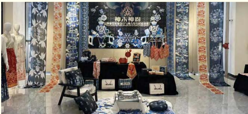
神木神韵(视觉传达设计)