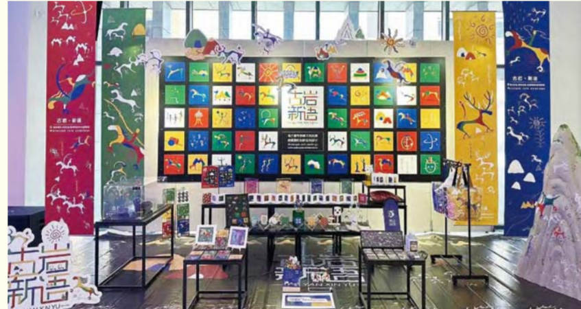
古岩新语(视觉传达设计)