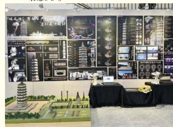
“塔之谱”万部华严经塔数字化虚拟展示设计 (环境设计) 李磊