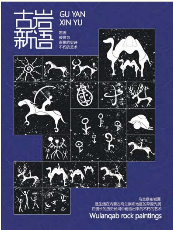
乌兰察布岩画文创品牌——“古岩新语”创新时间设计 (视觉传达设计) 姜哲