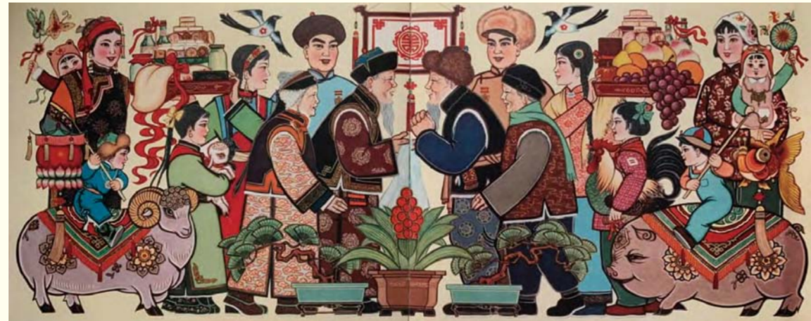
农牧连双喜 同庆万年春（年画） 20 世纪 60 年代 胡均

走访中，校领导班子成员与老前辈们促膝交谈，详细了解他们的身体状况和生活情况，认真听取了他们对学校改革发展的意见和建议，同时向老