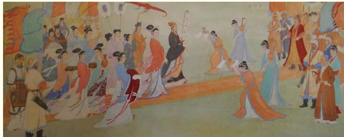
汉明妃和亲图（中国画） 卢宾