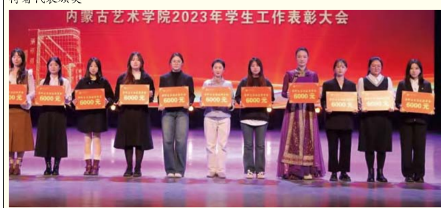
获得自治区奖学金本科生代表