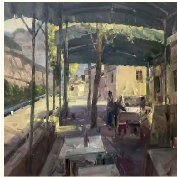
写生太行山 (布面油画) 董从民