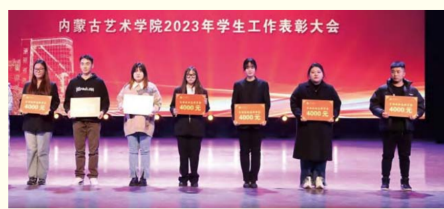
自治区励志奖学金获得者代表