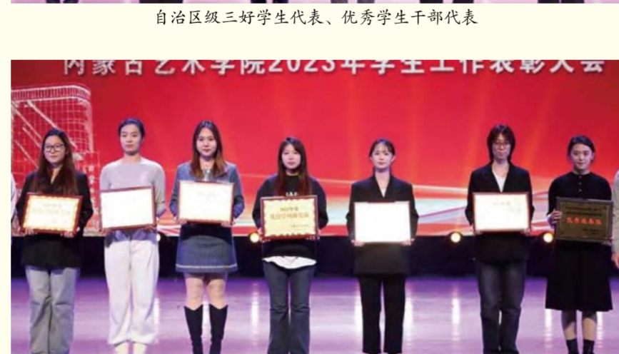
自治区级优秀班集体和学风建设优良班集体代表