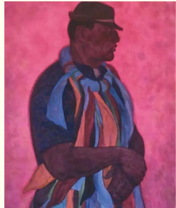
搏克手之十一 (水彩画) 颀元芳

12月5日上午,由我校主办、美术学院承办、呼和浩特市美术馆协办的“北疆风华,国之盛美”——内蒙古艺术学院美术学院研究生师生作品展,在呼和浩特市美术馆开展。本次展览旨在深入学习贯彻习近平文化思想,以美术作品展现北疆艺韵。我校有关部门负责人、美术学院师生代表、内蒙古师范大学师生代表参加开幕式。开幕式由美术学院副院长王茹主持,我校20余位美术专业硕士研究生导师和100余位硕士研究生的200余幅作品参展,涵盖了中国画、油画、版画、水彩画等多个门类。(编者)