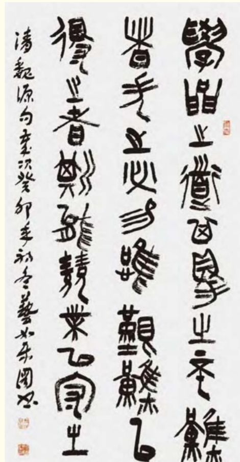
篆书作品(书法) 艺如乐园