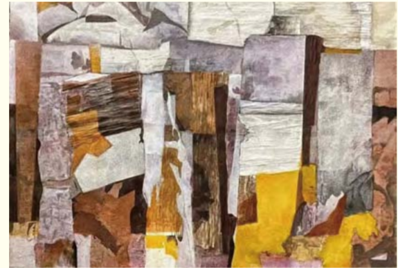
浮兰翠暖4 (综合材料绘画) 马媛