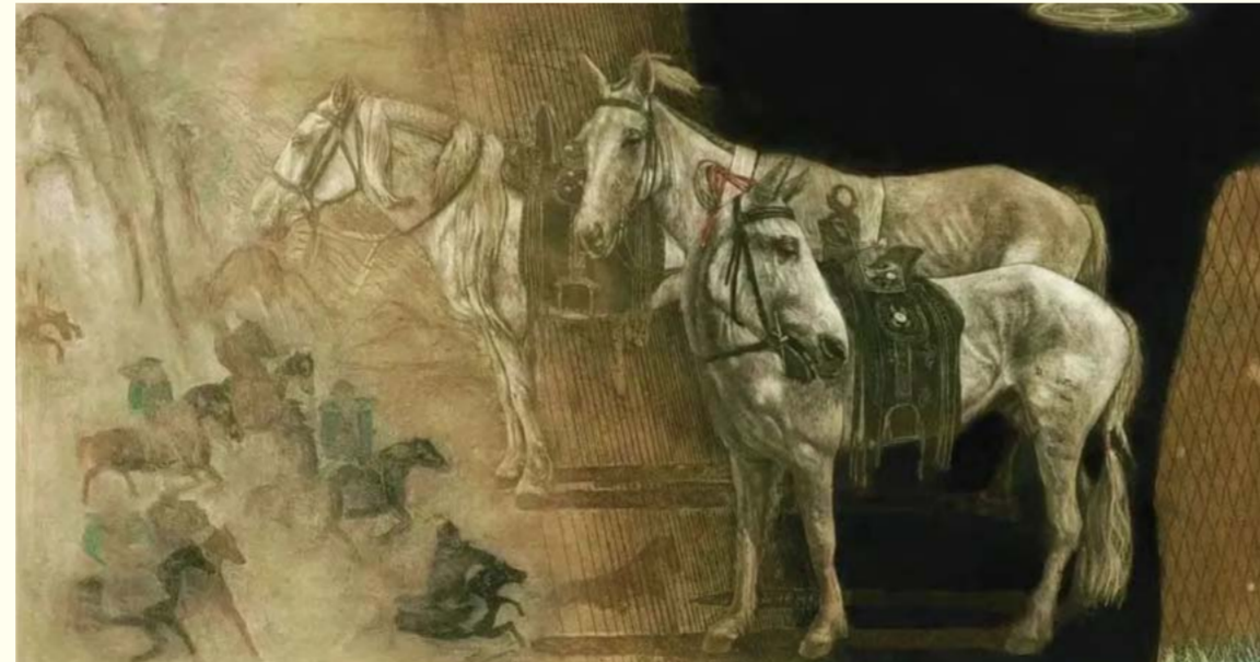
华夏北疆 (铜版画) 王茹