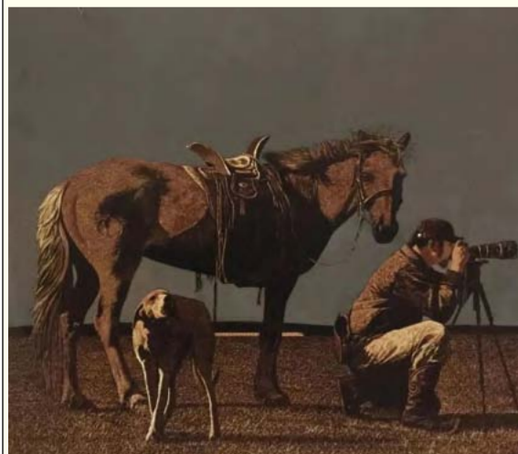
听见草原 - 聚焦 (木版画) 胡日查