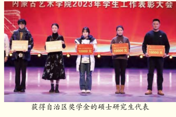
获得自治区奖学金的硕士研究生代表