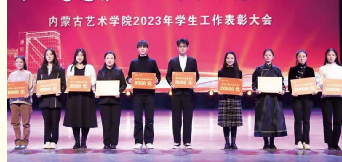
艺院风景线: 2023年国家奖学金获得者硕士研究生(右四位)、本科生(左五位)

作站成员、优秀大学生自律委员会成员、优秀朋辈心理辅导站成员、勤工助学之星、国防教育之星等先进集体、先进个人和奖学金获得者进行了表彰(表彰名单见本期三期版)。(潘多)