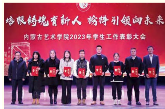
校党委副书记、院长赵海忠向学生工作先进个人颁发荣誉证书