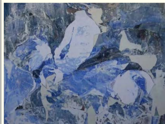
蓝色的梦想 (水彩画) 苏万循