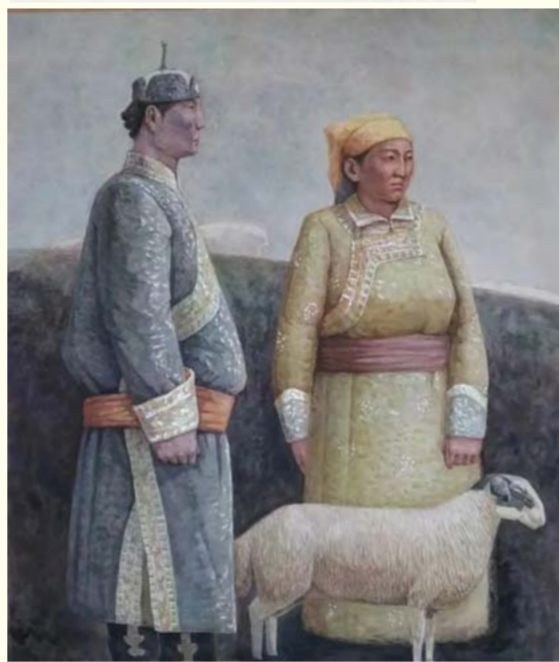
亘古·一 (水彩画) 云宇峰