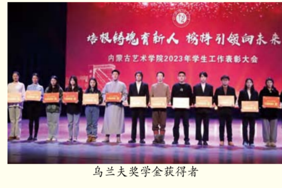
乌兰夫奖学金获得者